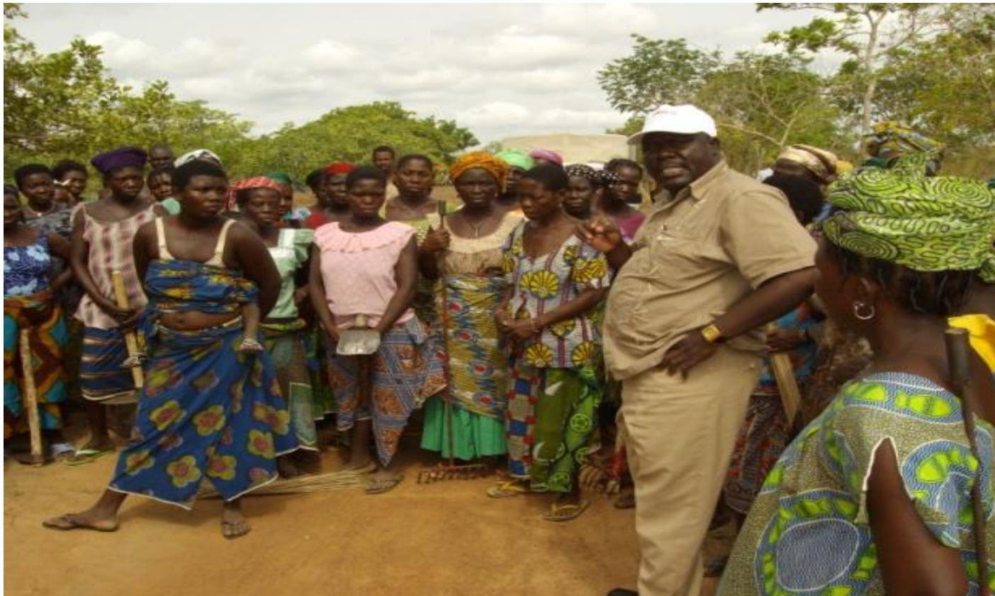
Photo 1 - Sensibilisation des populations sur leurs rôles et responsabilités