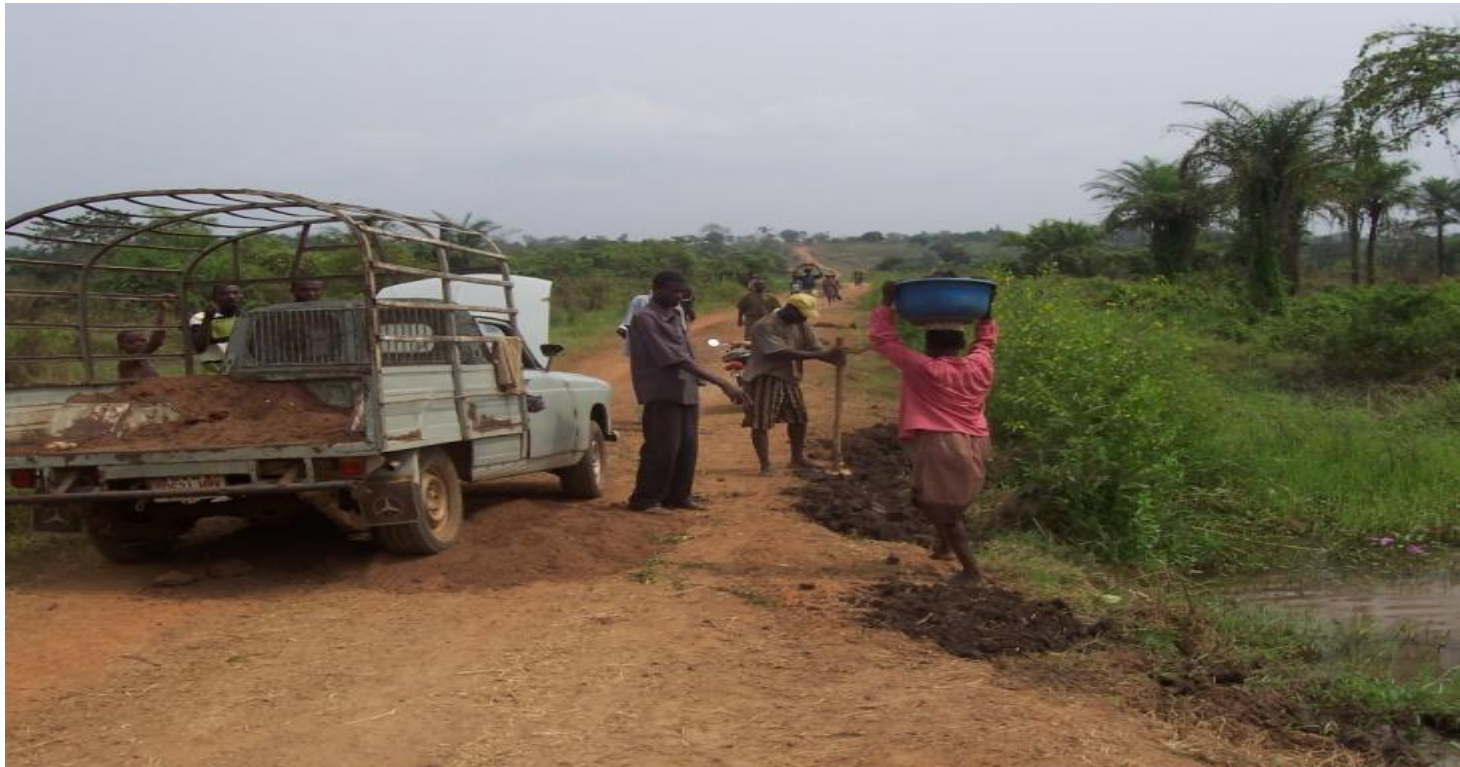
Photo 2 – Véhicule bâché et ouvriers déposant du matériau pour combler les dégradations