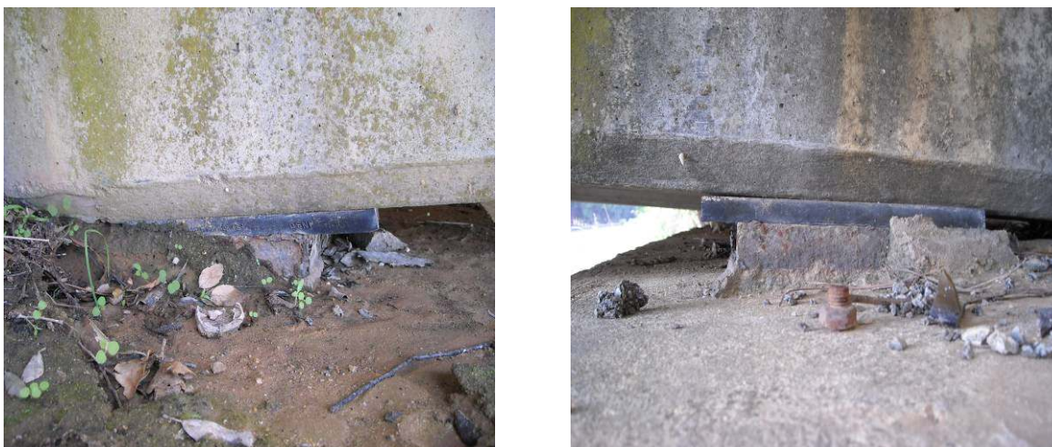
Figura 5 - Apoyos bloqueados o desplazados de su posición teórica