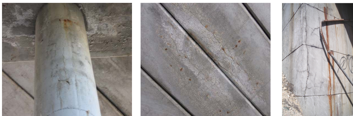
Figura 2 - Fisuras en fuste de pila, en vigas de tablero y en muro frontal de estribo