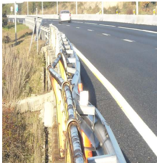
Figura 7 - Pérdida de sección de acero en barandilla y abollamiento en defensa metálica