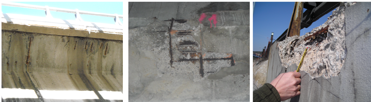
Figura 4 - Armaduras a la vista con rastros de oxidación y desconchón en paramento de hormigón