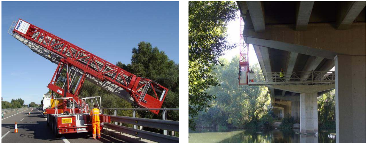
Figura 10 – Vistas de la pasarela autoportante utilizada en buena parte de las inspecciones

El medio especial mayoritariamente empleado fue un camión de 6 ejes dotado con una estructura metálica telescópica autoportante de acción oleodinámica, aunque también se utilizaron plataformas aéreas elevadoras, barcas, camiones con pluma telescópica, etc.