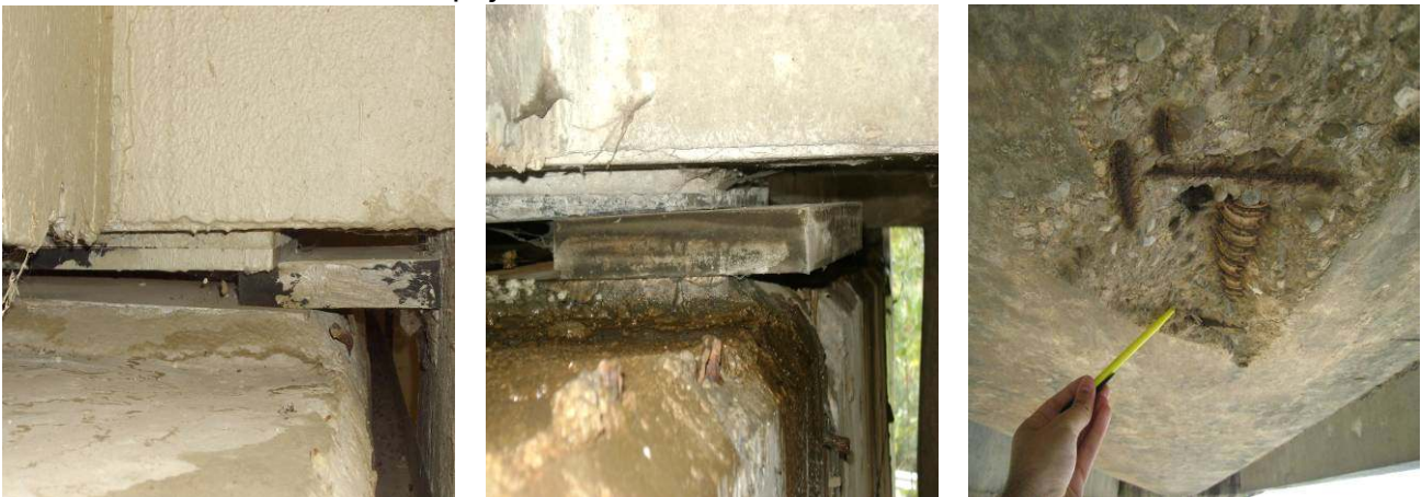
Figura 11 -Apoyos desplazados de su posición teórica y vaina de pretensado expuesta

Estas inspecciones sirvieron para detectar, entre otras anomalías, el desplazamiento de algunos apoyos, el cuarteamiento del neopreno de alguno de ellos, o la exposición a la vista de un trozo de vaina de pretensado adherente, amén de estados de fisuración que no se detectaron, a vista de pájaro, desde el terreno natural.