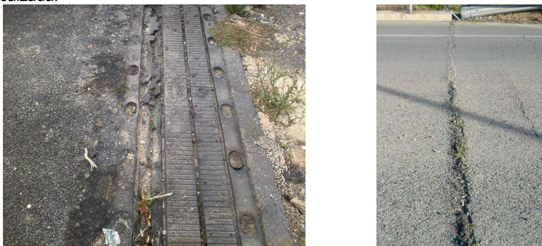
Figura 6 - Junta de calzada deteriorada o inexistencia de junta de calzada