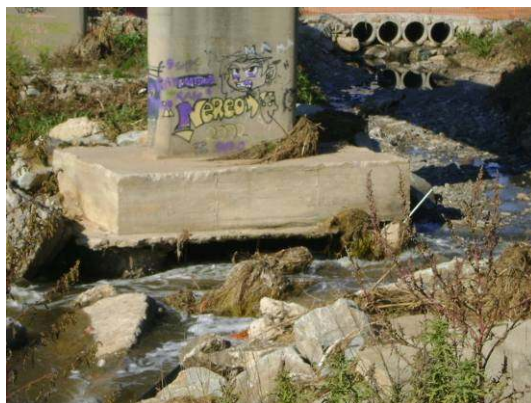
Figura 3 – Descalce en pila