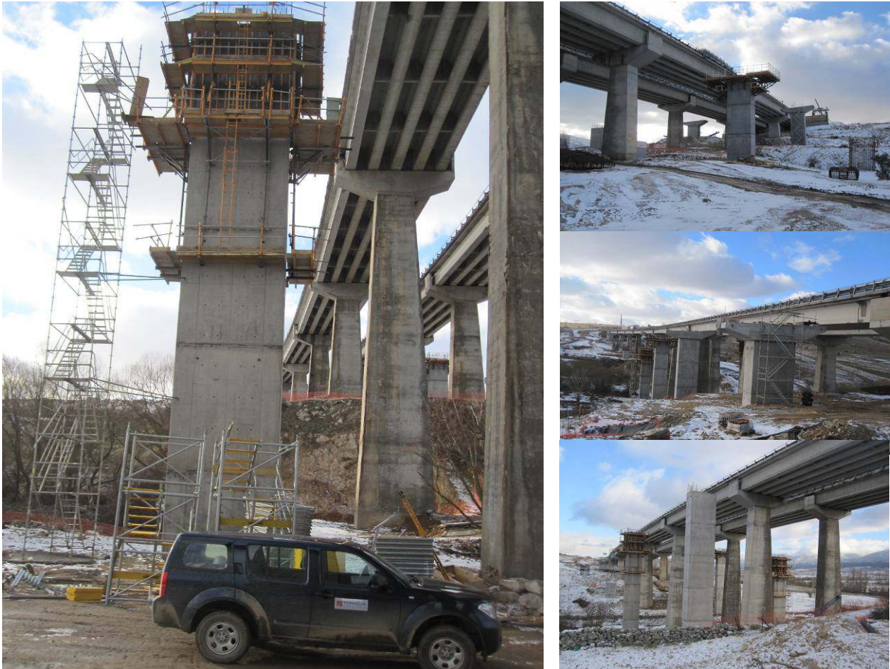
Figura 12 -Algunas vistas de las obras de rehabilitación de los viaductos de la AP-6

llevando a cabo otras actuaciones paralelas como, por ejemplo, la sustitución de apoyos del viaducto de La Jarosa, la reparación de pasos bajo la autopista y, de modo excepcional, la demolición y reposición de tres viaductos de vigas prefabricadas, cuyo hormigón estaba seriamente dañado por el ataque de cloruros, proveniente de los fundentes empleados año tras año, en las campañas de vialidad invernal.