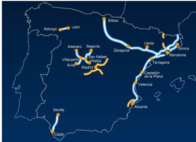
Figura 1 – Red de Autopistas gestionadas por Abertis Autopistas España

En la tabla que sigue se presentan las características principales de las estructuras (longitud, anchura y superficie) agrupadas en función de su tipología (puentes o viaductos, pasos superiores, pasos inferiores y pasarelas).