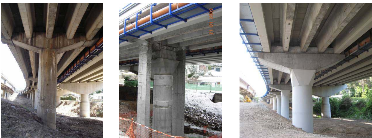
Figura 13 –Rehabilitación de pilas en un viaducto de la AP-6