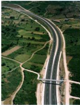
A-75 Verín - Portugal