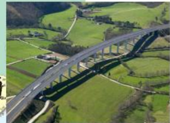
A-8 Careira - Abadín