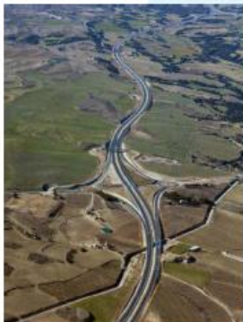
A-22 Vte Barbastro