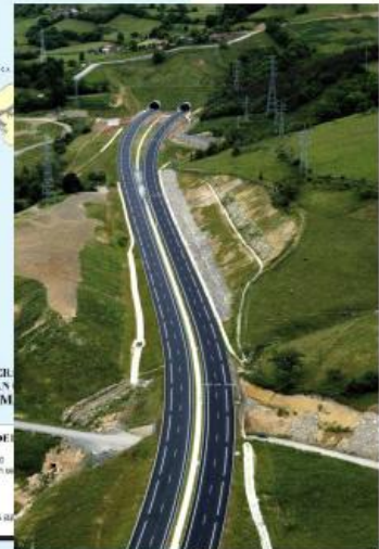
A-63 Grado - Doriga